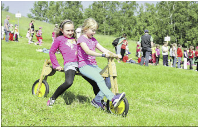
Hölzernen Spaß ermöglichte das Radkulturzentrum Vogtland

Gewolltes Fazit: Wer so die Natur kennen lernt, achtet sie auch!