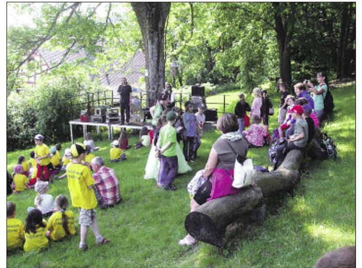
Stimmungsvolle Kindermusik und Mitmachlieder im Grünen mit dem Musiktheater Spielart

gering zugehört sowie nachgefragt. Wann können sich denn Kinder am Melken versuchen, selbst Apfelsaft