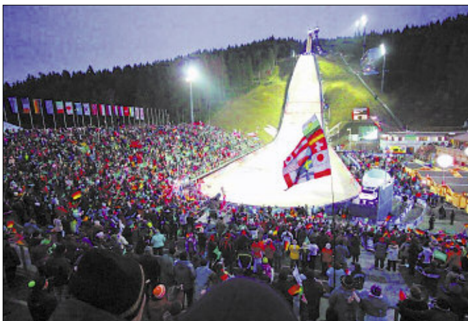
Wie im Vorjahr wird sicher auch am 22. und 23. November zum Weltcup-Auftakt der Skispringer in der Vogtland Arena Klingenthal wieder eine tolle Stimmung sein.

Der Vorverkauf für die Tickets zu allen Wettkämpfen wird noch im Juni beginnen. Weitere Informationen unter www.weltcup-klingenthal.com