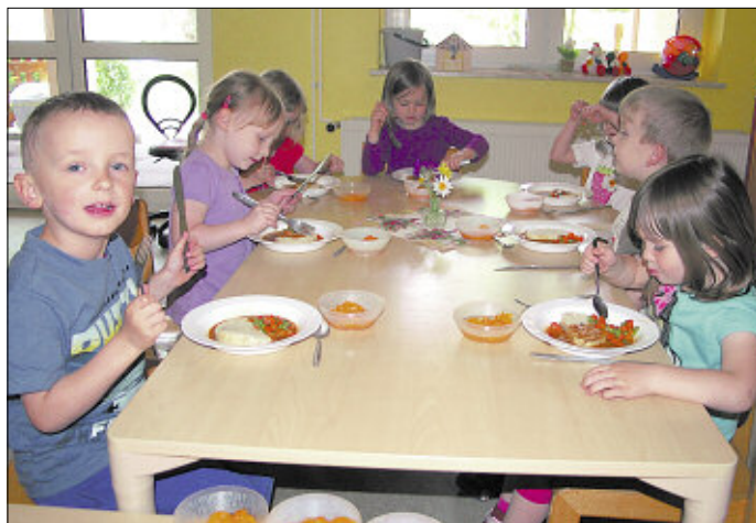
Genüsslich verspeisen die Käferkinder Knödel mit Gemüse und Geschnetzeltem. Als Dessert gibt es Mandarinenkompott.

tretende Leiterinnen fungieren. So gibt es als Beilagen Kartoffeln, Nudeln, Reis, Knödel und Kartoffel-