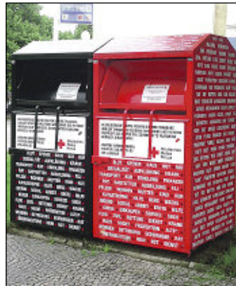
lps/Cb. Unverdächtig: DRK-Sammelbehälter

sondern auf privatem Grund stehen. Es sollte deshalb nur noch feste Standorte geben, um die sich die Aufsteller bewerben müssen. Die Bewerber sollten auch selbst Sammler sein und nicht von Dritten (rein kommerziellen Verwertern) vorgeschoben werden. Die Textilien sollten fachgerecht sortiert und verwertet werden. Erwünscht sind regelmäßige Leerung, mindestens ein jährlicher Bericht über die Mengen sowie deren überwiegend gemeinnützige Verwendung.