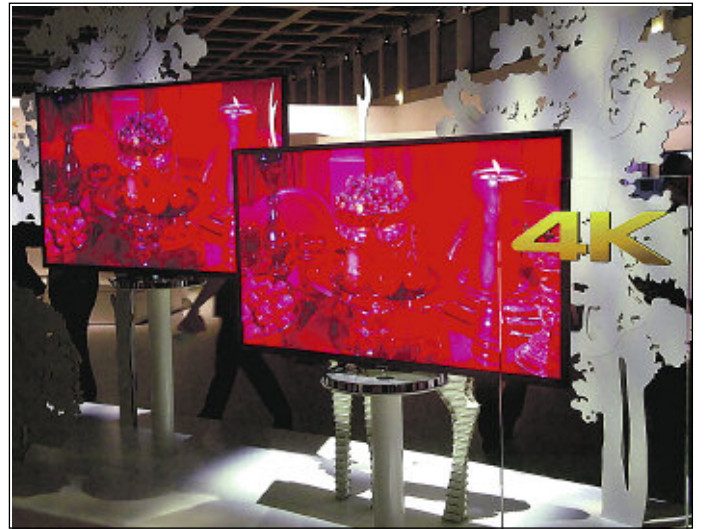
lps/Cb. Heute hochmodern – morgen Elektroschrott

verwertung gibt, sollte man prüfen, ob sich nicht noch eine SIM-Karte und / oder eine Speicherkarte im Gerät befindet. Wer um seine persönlichen Daten fürchtet, sollte auch die im Gerät selbst gespeicherten Daten löschen.