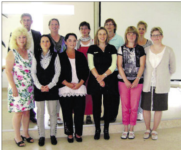
Acht Absolventinnen können nun nach einer Woche Weiterbildung die Palliative-Care-Arbeit in der Region mit ihren erworbenen Kenntnissen unterstützen.

Interessenten können sich beim Hospizverein direkt erkundigen: Tel. 03744 3098450 oder 03765 612888.