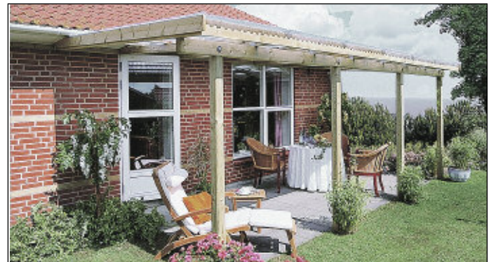
lps/Ke. Das Wohnzimmer im Freien – eine schöne Terrasse lädt zum Verweilen ein.

ecke. Die zweite Ebene sollte als Spannungsbereich gesehen werden, mit vielseitig nutzbaren Sitz- und Liegemöglichkeiten, wie beispielsweise eine gemütliche Hängematte oder Gartenliegen mit verstellbarer Rückenlehne. Um die Terrasse auch bei Regen oder in der starken Mittagssonne nutzen zu können, ist es ratsam, sie ganz oder teilweise zu überdachen.