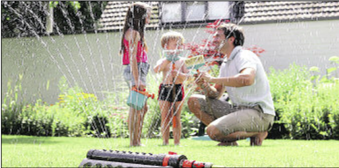
lps/Ke. Gut durchfeuchtet reicht es, den Rasen auch im Sommer nur zweimal wöchentlich zu gießen.

Kürzere Intervalle mit einer geringeren Wassermenge begünstigen die Wurzelbildung an der Oberfläche, was den Rasen noch anfälliger für Trockenheit macht. Morgens ist der beste Zeitpunkt um den Rasen zu sprengen, da das Wasser genügend Zeit hat zu verdunsten. So kann sich nachts kein Schimmel bilden. Auf keinen Fall sollte der Rasen bewässert werden, wenn die Sonne hoch am Himmel steht. Bei größeren Gärten sollte über eine fest installierte Bewässerungsanlage nachgedacht werden, die automatisch über einen Computer gesteuert wird. Auch in der warmen Jahreszeit muss der Rasen gedüngt werden. Am effektivsten hat sich dabei Langzeiddünger erwiesen, denn dieser zieht gut in den Boden ein und versorgt das Grün über einen längeren Zeitraum mit den Nährstoffen. Industrie- und Landwirtschaftsdünger sind eher zu meiden. Auch beim Düngen gilt, ebenso wie beim Bewässern, direkte Sonneneinstrahlung zu vermeiden.