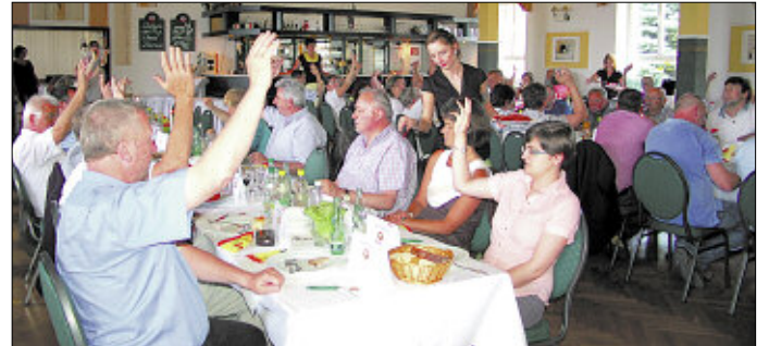
Insgesamt vergaben die Juroren 15-mal Vogtland-Gold und einmal Vogtland-Silber.

bach/Rebesgrün für Lachsschinken, Fleischerei Geuthner Rosenbach/Syrau für Bierschinken, Fleischerei Schneider Treuen für