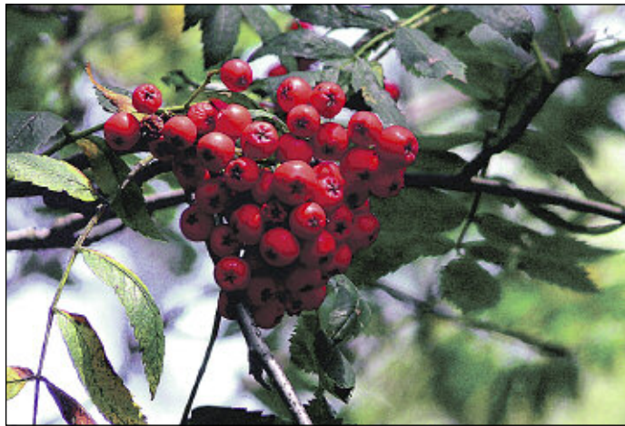
lps/Sk. Auch Wildbeeren, wie die Vogelbeere, eignen sich hervorragend zur Herbstdekoration. Foto: S. Keller

Natur kann man jetzt schöne Arrangements zaubern: Hagebutten, Zieräpfeln, Lampionblume, Zierkohl und buntes Laub sind nur einige Beispiele. Neben der