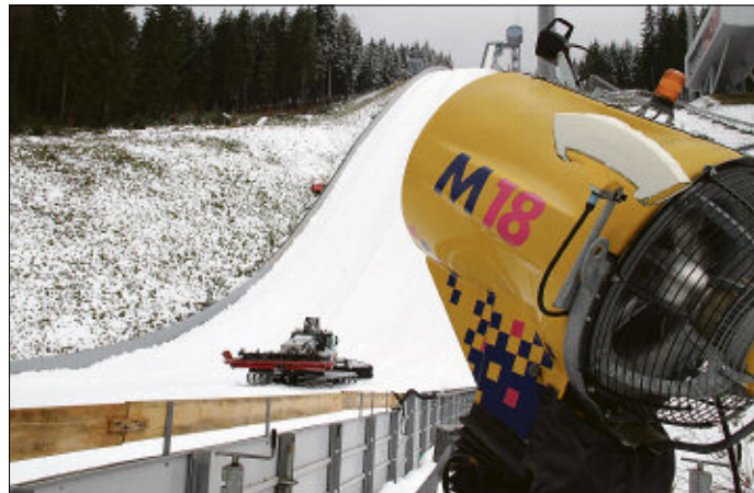
Und wenn alle mitfeiern, hüllt sich die Sparkasse Vogtland Arena im Dezember in ein schneeweißes Kleid wie auf unserem Foto.

Bereits am 30. September und 1. Oktober soll in Klingenthal außerdem das Finale des FIS Continentalcups der Skispringer stattfinden. Nur einen Tag später folgt mit dem Finale des FIS Sommer Grand Prix das erste Stelldichein der weltbesten Skispringer vor den Fans in der Sparkassen Vogtland Arena. Ebenfalls vorgesehen ist ein Continentalcup der Nordisch Kombinierten im weiteren Verlauf des Winters. Ein endgültiger Termin wird aber wohl erst beim FIS Kongress feststehen.